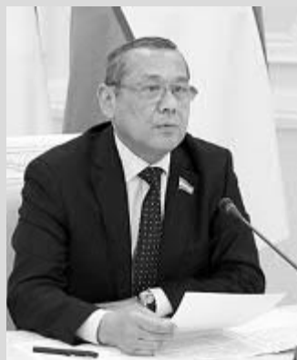
УЛУГБЕК ИНОЯТОВ, Олий Мажлис Қонунчилик палатасидаги ҲХДП фракцияси раҳбари:

— Кейинги йилларда юртимизда коррупцияга қарши курашиш бўйича янги тизим яратилди ва у доимий равишда такомиллаштириб борилаётган. Тизимнинг самарали ишлаши жуда кўп омилларга боғлиқ ва Коррупцияга қарши курашиш агентлиги бу борада мураккаб, кенг кўламдаги ишларни бажараётганини эътироф этиш зарур.