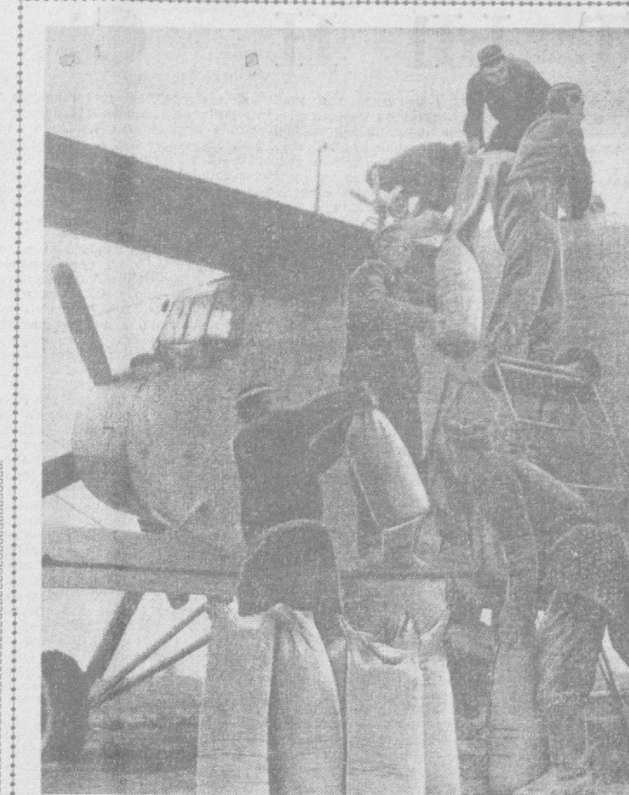
Декабрьский Пленум ЦК КПСС указал, что химизация и механизация сельского хозяйства сейчас должны быть предметом особой заботы всего народа. Коллектив совхоза «Риштан» Аштаркского производственного управления делом отвечает на решение Пленума. Особое внимание обращено в совхозе на внесение минеральных удобрений во время подъема зноя. На снимке: загрузка самолета суперфосфатом для авиации под заблаговременную аспышу.