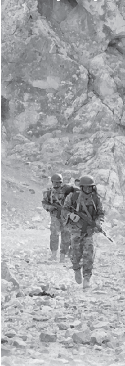
(Давоми. Боши ўтган сонда)