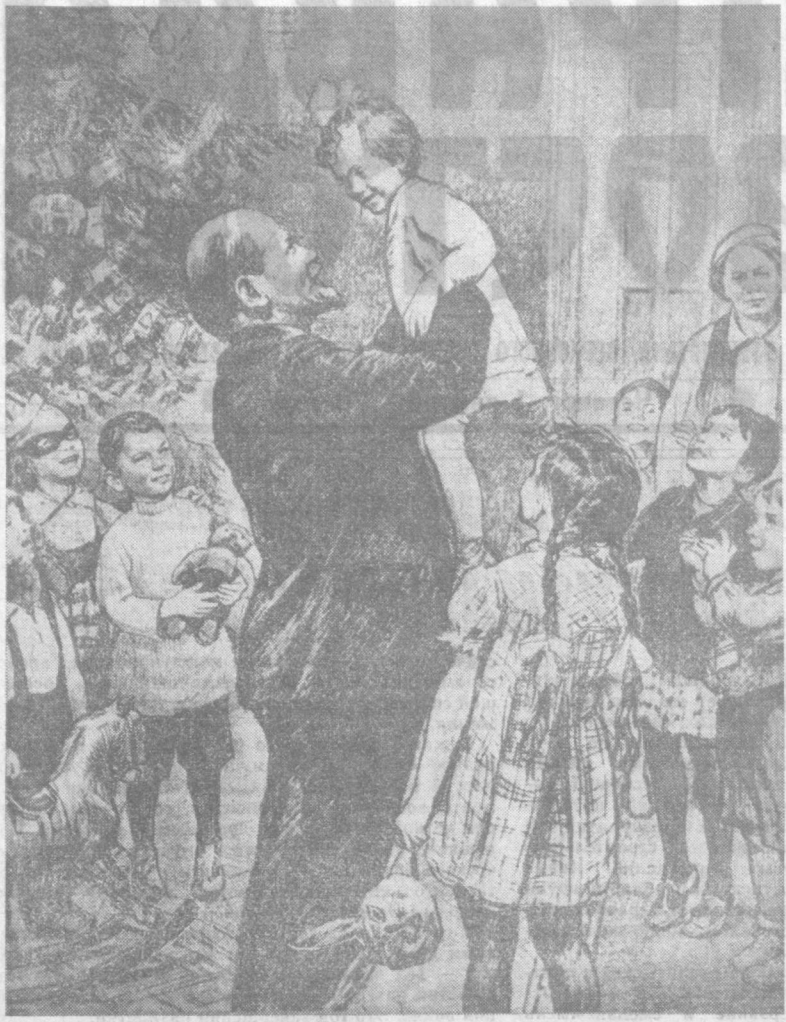
Рис. Н. ЖУКОВА.

шумящую аудиторию, глаза его зажглись огнем. Минут двадцать он сидел в заднем ряду, расспрашивал, из каких предприятий присутствуют рабочие, слушал, а потом попросил провести себя на сцену. Когда он шел, Ильича узнали. «Ильича», — шепотом пронеслось по залу. Ильич снял пальто, спросил, кто о чем говорил, и нежданно для президента появился на сцене. Зал вздрогнул и затрепетал тысячей рук. Долгие, неслыханные аплодисменты не давали возможности начать Ильичу, и когда взволнованный зал умолк, Ильич начал. Четкое, маткое, близкое сердцу собранных слово заворожило зал. Говорил он о прошедших годах борьбы и о новом наступающем годе, таящем в себе новые испытания рабочему классу, да и вряд ли последние. — Крепка, товарищи, мощь пролетариата, и в новом году так же крепко и дружно станем на защиту завоеваний революции! Кончить не дали, громом грянул зал. Ильич стоял, улыбался, смотрел на аудиторию своими светлыми, прищуренными глазами.