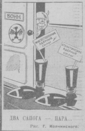
Рис. Г. Колчинского.

очень похожи один на другой. Оба эти плана открывают боковой фронт в развитии доступа к ядерному оружию. (Из газет).