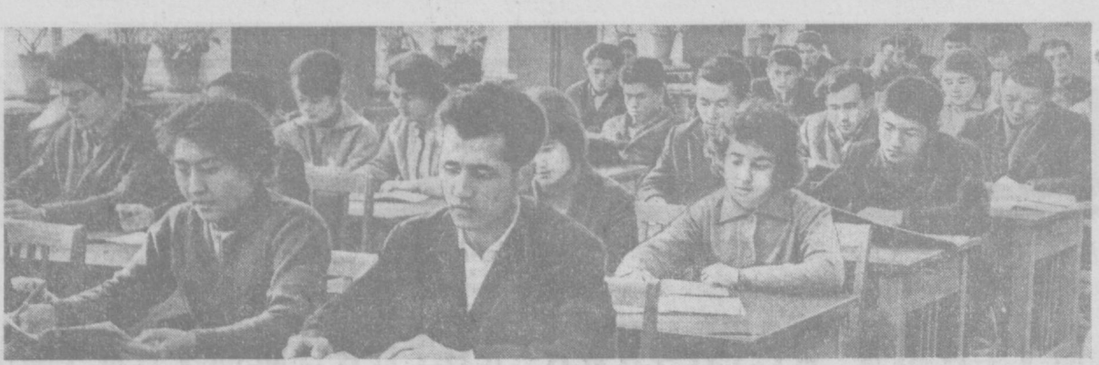
Юноши и девушки, обучающиеся в высших учебных заведениях Узбекистана, созданы все условия для плодотворной учебы. Им предоставлены просторные аудитории, отлично оборудованные технические кабинеты, читальные залы. На снимке: студенты Ташкентского института народного хозяйства в читальном зале.