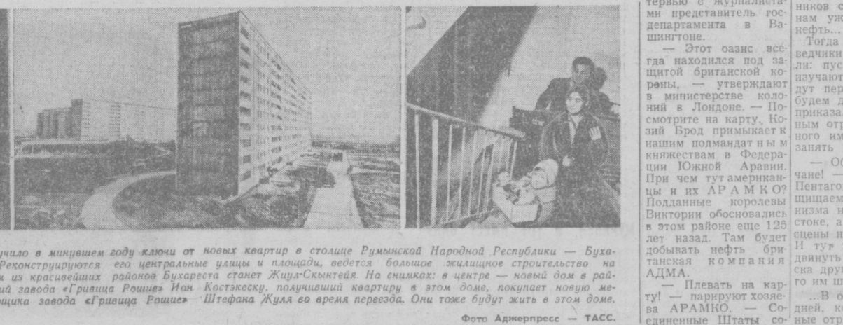
Около пятнадцати тысяч семей получили в минувшем году ключи от новых квартир в столице Румынской Народной Республики — Бухаресте. Город растет вверх и вширь. Реконструируются его центральные улицы и площади...