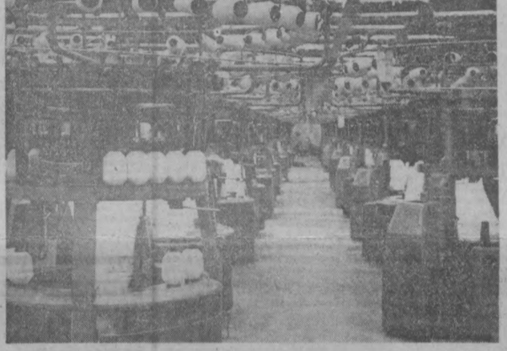
Постоянно расширяется производство, осваиваются новые виды изделий на Анданманской трикотажной фабрике имени 50-летия ВЛКСМ. В этом году здесь начнут вырабатывать верхний трикотаж из синтетического волокна. Для этого в цехе установлены новейшие высокопроизводительные машины. Участок цеха с новой техникой вы видите на этом снимке.

Успех пришел не сразу. По существу ошутимый скачок произошел в 1968 году. И не случайно наш мя-