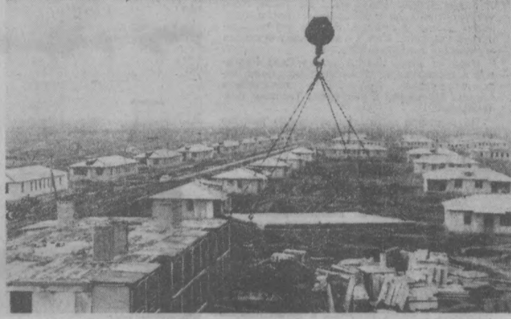
Совхоз продолжает строиться.

Тезисы ЦК КПСС к 100-летию со дня рождения Владимира Ильича Ленина — в массы!