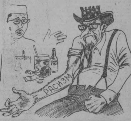
Нет, сэр, обычными средствами этого не вытравят... Рис. Ю. БРОДИЧКО.

Руководители США пытаются скрыть от внимания мировой общественности расовое бесправие и гнет, царящие в Америке. (Из газеты).