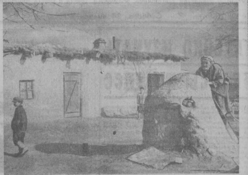
С ТОЙ ЖЕ ТОЧКИ. Так стало (верхний снимок). А так было.