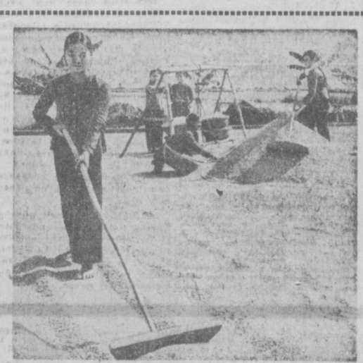
Земледельцы Демократической Республики Вьетнам, несмотря на суровые условия военного времени, выжили богатый урожай риса. На снимке: сбор обильного урожая в одном из кооперативов в провинции Намха.

ПАРИЖ, 9 января. (ТАСС). Житель города Боввер (департамент Гар) получил на днях открытку от одного из своих старых друзей из местечка Куркурор. Открытка находилась в пути — этот путь составляет 150 километров — 61 год.