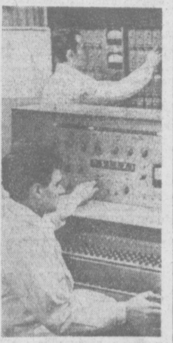
В лабораториях Среднеазиатского научно-исследовательского института природного газа установлена новейшая электронно-вычислительная техника.

В Ташкенте начались занятия на республиканских курсах преподавателей экономики и организации промышленного и сельскохозяйственного производства.