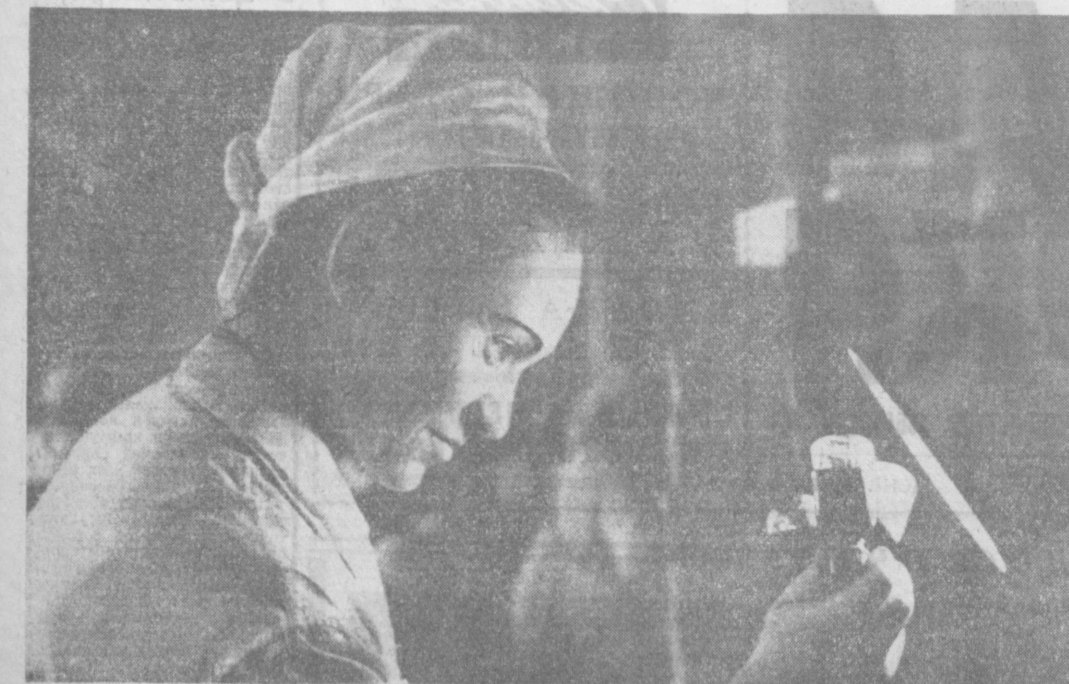
Отличный старт в третьем году пятилетки...