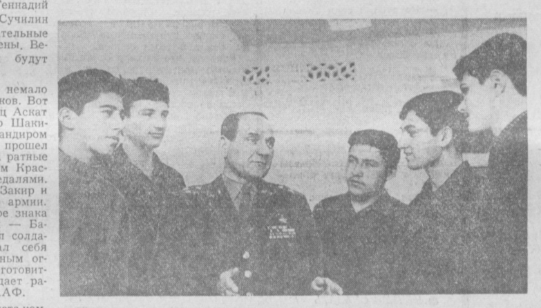
Герой Советского Союза полковник М. Задорожный беседует с молодежью — будущими солдатами Вооруженных Сил СССР.

новал идею защиты социалистического Отечества и создания Вооруженных Сил, разработал важнейшие принципы строительства армии.