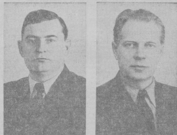
К. Т. МАЗУРОВ. Член Президиума ЦК КПСС. Д. Ф. УСТИНОВ. Кандидат в члены Президиума ЦК КПСС, секретарь ЦК КПСС.

вели значительную работу по развитию сельского хозяйства. Важное значение имел сентябрьский Пленум ЦК КПСС 1963 года. Он разработал правильный курс в области сельского хозяйства. И надо прямо сказать, пока его решения проводились в жизнь, мы имели определенные результаты.