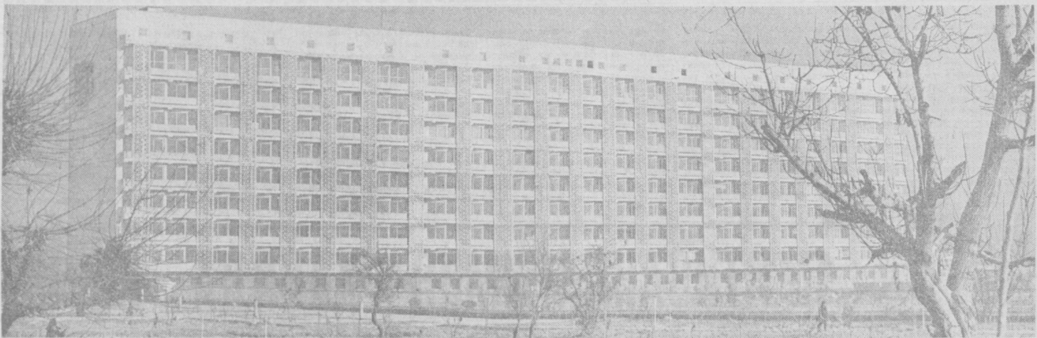
Тошкентда Ўрта Осиёда ягона ҳисобланган хирургия маркази иш бошлади.