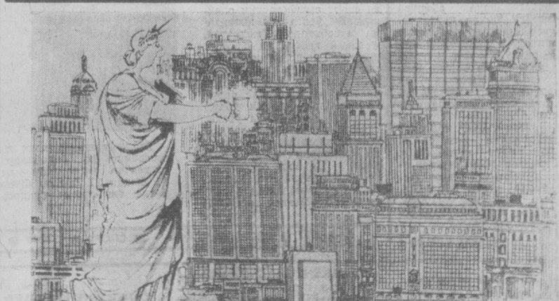
АҚШнинг йирик молна маркази Нью-Йорк банкротга учраш ҳавфи остида. Шаҳар алдақчилар четдан олинган қара ҳисобига ҳаёт кечирмоқда. (Газетдан). Озодлик раман бўлган ҳайкал тилдамчилик қилмоқда. «Тайм» журналида босилган қарикатурадан.

Учрашувда мамлакатдаги аҳвол ва уни нормаллаштиришнинг иккинчи бор йўллари муҳоказма қилинди. Матбуотнинг хабар беришича, Р. Караме вазиянтининда кескинлашувни хатарли эканлигини таъинлади. Ливан халқининг бирлигини сақлаш кераклигини айтди. Тараққипарвар социалистик партия раиси К. Жумблат ўз нутқида баъзи доиралар кўрағини мамлакатнинг бўлиб юбориш режаларини сақлаётганлиги хатарли эканлигини қўрасини ўтди. У Ливанни бўлиш Исроилнинг араб билан миллати душманларининг маюфатларига мос бўлиб тушишини, миллий ватанпарварлик кучлари тағлиқни енесиб нўл билан тезорқ бартараф этиш учун курашаётганлигини таъинлади.