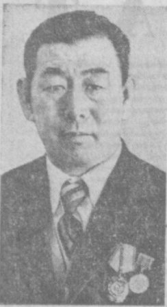
КОЛХОЗДА ўн саккиз йилдан буён бош инженерлик вазирасида ишлаб келмоқдаман. 1958 йилда хўжалигимизда бор йўли беш-олтита терим машинаси, ўнча ҳайдов трактори, ўн бешта чопиқ трактори мавжуд эди. Ҳар бир машина билан ўртача 20—30 тоннадан пахта терилар эди. Эндиликда эса қудратли машина — трактор паркига эга-

миз. Механизация ҳар бир соҳада деҳқонга қанот — маддот қилиб қолди. Ҳозир колхозимизда 20 та турт қаторли «Узбекистон», 7 та икки қаторли пахта терим машинаси, 70 тадан ортиқ ҳайдов ва чопиқ тракторлари ва бошқа механизмлар бор. Қишлоқ хўжалигини механизациялаш даражаси йил сайин ортиб бормоқда. Утган йили машиналар билан 90,8 процент пахта териб олинди. Ҳар бир машина билан ўртача 20—30 тоннадан пахта терилганга етиб қолди.