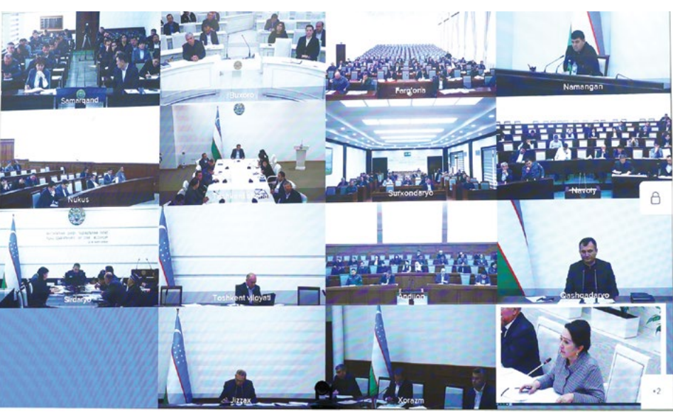
Саймон Абдурашмов ошган суратлар.

Маълумот ўрнида қайд этиш жоизки, «Аёллар дафтари»нинг 4-босқичи 2023 йилнинг 5 январь кунидан бошланади. Бунинг учун жойларда давлат ва жамоат ташкилотлари вакиллари билан иборат ишчи гуруҳлар тўзилади. Ишчи гуруҳ таркибига маҳалла раиси, хотин-қизлар фаоллари, ҳоким ёрдамчилари ҳамда туман (шаҳар) ташкилотларидан вакиллар жалб этилади. Ўрганиш жараёнида 75 минг нафар масъул қатнашади.