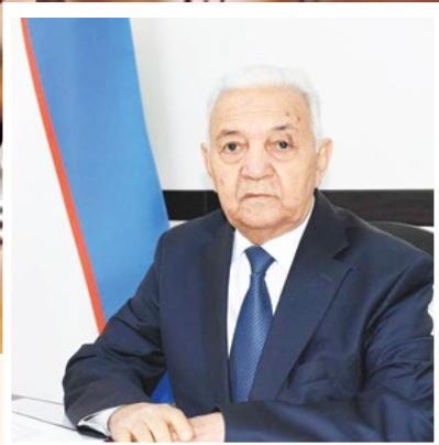
Убайдулла МИНГБОВ, Ўзбекистон Судьялар ассоциацияси раиси, Ўзбекистонда хизмат кўрсатган юрис

ёки икки юз қирқ соатгача мажбурий жамоат ишлари ёхуд бир йилгача ахлоқ тузатиш ишлари билан жазоланиши мумкин дейилган.