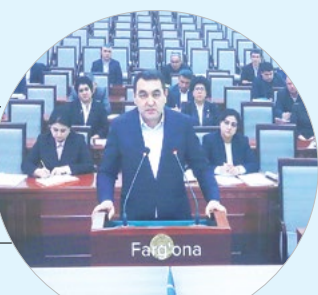
Хайрулла БОЗОРОВ, Фарғона вилояти ҳокими:

– «Аёллар дафтари»даги олтинга йўналиш бўйича буғун амалга оширган ишларни санасак, адоғига етолмаймиз. Мухими, қўловни ёрдамга муҳтож хотин-қизлар ўз турмуши тарзиди сезишди. Уларнинг кайфияти ўзгарди.