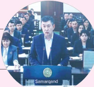
Эркинжон ТУРДИМОВ, Самарқанд вилояти ҳокими:

– «Темир дафтар», «Аёллар дафтари», «Ёшлар дафтари» тизими жойларда фаолият юритаётган сектор раҳбарлари учун ҳақиқий аҳолини билшида катта ёрдам бўлди, десам асло муболага эмас. Айниқса, хотин-қизларнинг муаммосини тизимли ҳал қилиш, уларни ҳар томонлама рағбатлантириши мақсадида тўзилган махсус комиссиянинг ўрни алоҳида. Ушбу комиссиянинг саъй-ҳаракати билан ўтган давр мобайнида Самарқандда 651 минг нафардан ортиқ аёлнинг муаммоси ўрганилиб, шундан 66 минг нафари «Аёллар дафтари»га рўйхатга олинди. Тегишли тоифалар доирасида уларга кўмак берилди. Ушбу ишлар учун 94 миллиард сўм маблағ йўналтирилди. Сектор раҳбарларининг ташаббуси билан 5 минг 200 нафар хотин-қиз республика бўйлаб саёҳатга юборилган бўлса, 1400 нафардан ортиқ аёл касб-хунарга ўқитилди. Шу билан бир қаторда, Нукус туманидаги 10 нафар ёрдамга муҳтож аёлнинг уй-жойи таъмирлаб берилди.