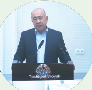
Зоир МИРЗАЕВ, Тошкент вилояти ҳокими:

– Қардаки аёл рози бўлса, ўша жойда тинчлик-хотиржамлик, фаровонлик ҳукм суради. «Аёллар дафтари» тизими эса мана шу йўлда биз мутасаддиларга маёқ вазифасини ўтамоқда. Ушбу йўналиш ҳақиқатан ҳам хотин-қизлар муаммоси ҳал этилади, улар суянадиган тизим сифатида шаклланиб улгурди. Одамлар билан мулоқот чоғида кўряпмизки, уларнинг бу дафтарга ишончи баланд.