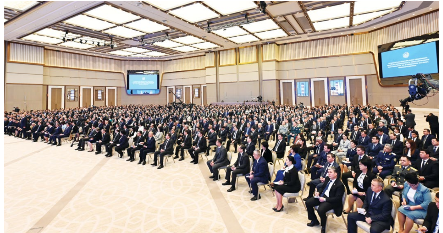
Пойтахтимиздаги Халқаро конгресс марказида бўлиб ўтган тадбирда Олий Мажлис Сенати аъзолари ва Қонунчилик палатаси депутатлари, давлат ташкилотлари раҳбарлари, жамоатчилик вакиллари иштирок этди. Мурожаатнома ўндан ортиқ телеканал орқали жонли эфирда, шунингдек, Президентнинг ижтимоий тармоқлардаги саҳифалари орқали онлайн ёритиб борилди.