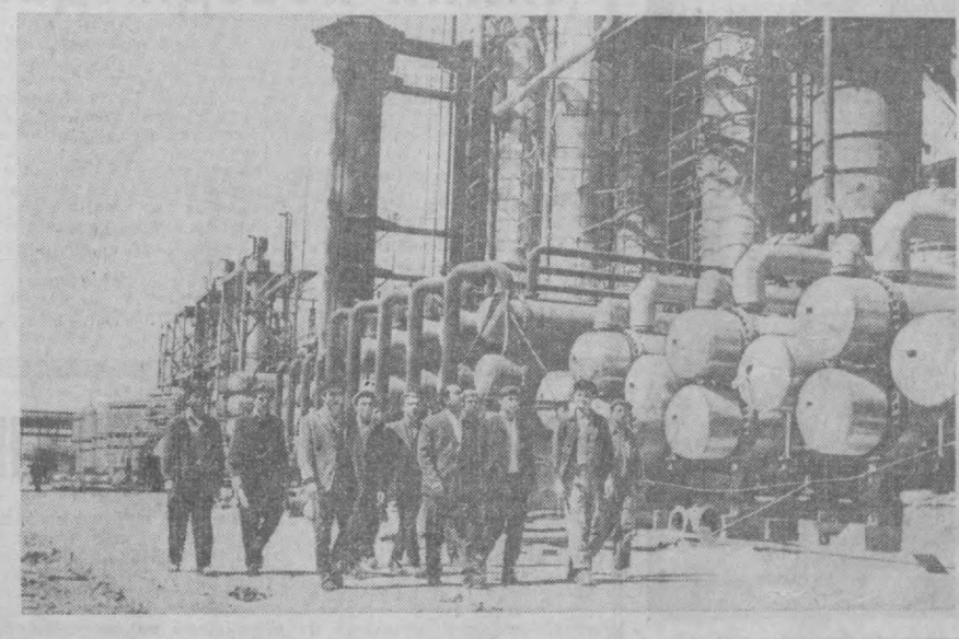
На снимке: один из участков Новойского хмкобкомбината.