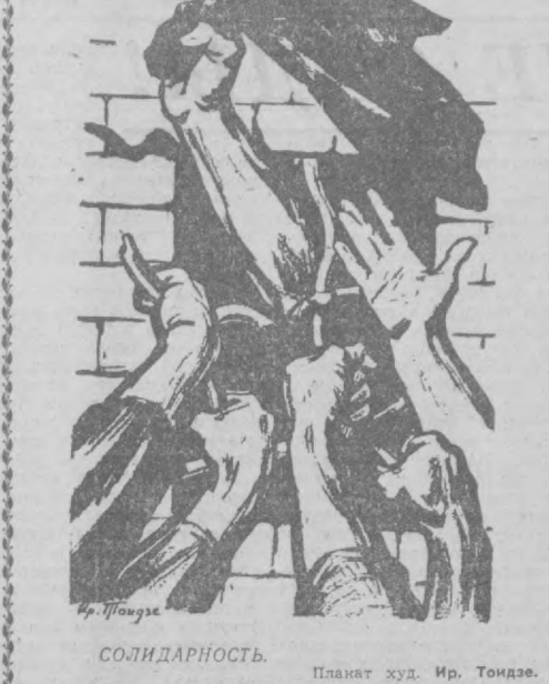
СОЛИДАРНОСТЬ. Планшет худ. Ир. Тондзе.