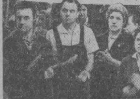
Митинг солидарности рабочих-печатников Москвы с патриотами Латинской Америки.