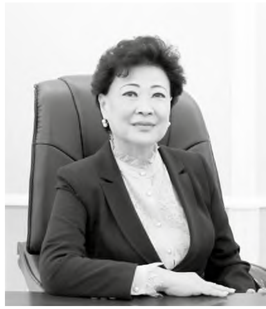
Агрипина Шин. Министр дошкольного образования Республики Узбекистан.

пианино и интерактивных досок для оснащения некоторых детских садов нашей страны. В сотрудничестве с отечественной компанией EduLink разработано мобильное образовательное приложение «S-Board» для дошкольных образовательных организаций, которое используют дети, родители и педагоги. Также в июне нынешнего года Корейским агентством по международному сотрудничеству организованы два недельных курса по повышению квалификации 20 педагогов.