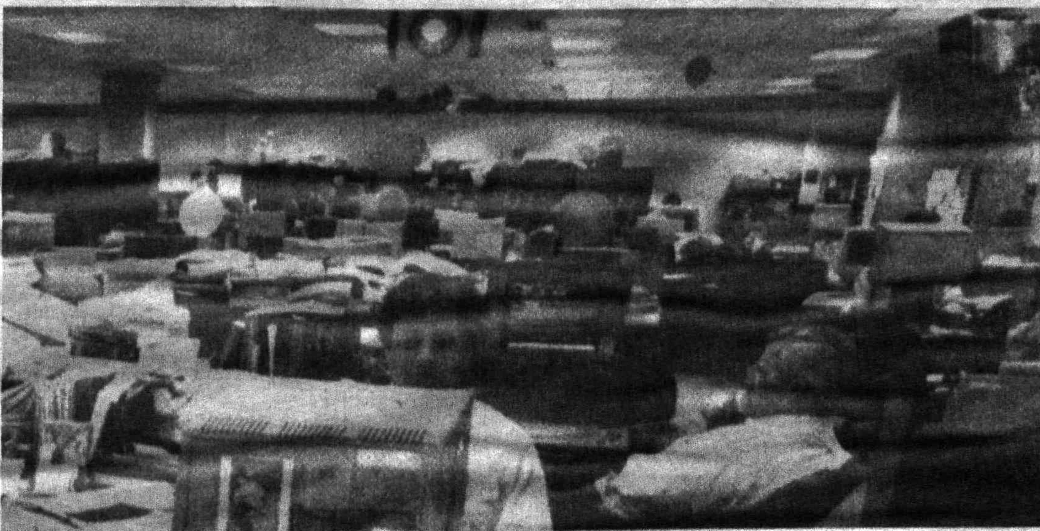
Зал, где работают репортеры известной американской газеты «Сан» из города Балтимор.

Нищие в Германии не платят налогов, им не требуется разрешения на занятие «промыслом», но благопристойный облик страны они явно не украшают. В отдельных городах, как недавно в Штутгарте, принимают решение «очистить город от нищих, собранные деньги конфисковать». В других местах, как во Франкфурте, запрещают «агрессивное пристраивание» — навязчивое приставание к прохожим. Но все эти меры проводятся с большими отступлениями от предписанного, поскольку власти не решаются притеснять настоящих нищих, которые все же есть и в этой богатой, достаточно заботливой о бедных стране.