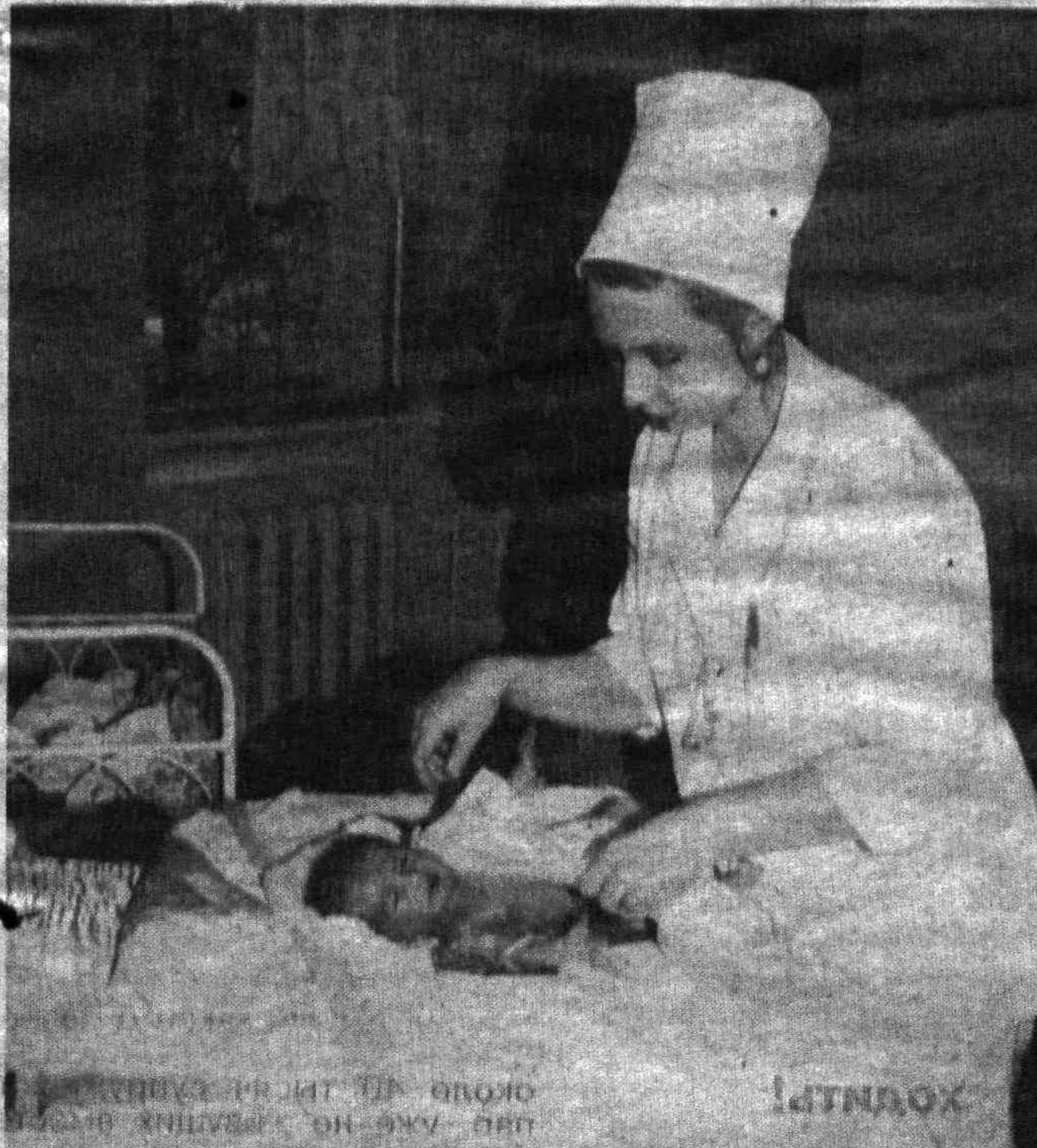
На снимке: в роддоме № 6 г. Ташкента: еще одним Маратиком стало больше!

либо причине ваша супруга не может посетить нотариальную контору, вы можете пригласить нотариуса на дом. В том случае, если доверенность оформляется на лицо, находящееся в больнице, либо другом медицинском стационаре, она может быть заверена главным врачом данного медицинского учреждения.