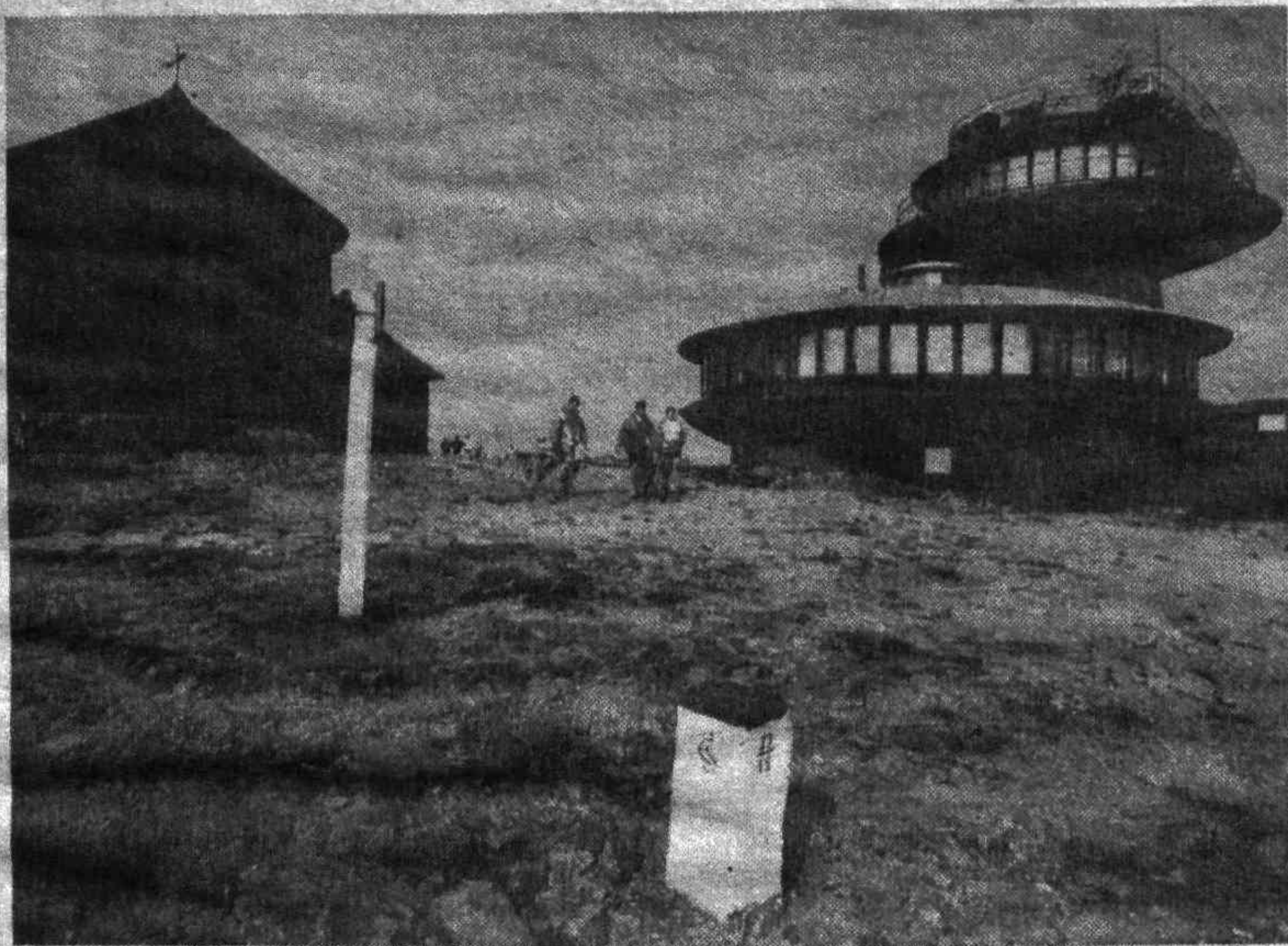
ТАК ВЫГЛЯДИТ СЕГОДНЯ УЧАСТОК ПОЛЬСКО-ЧЕШСКОЙ ГРАНИЦЫ НА ГОРЕ СНЕЖКЕ.

Обстановка в Тиране практически нормализовалась. Город контролируется уличными нарядами милиции, выполняющими указания коалиционного правительства.