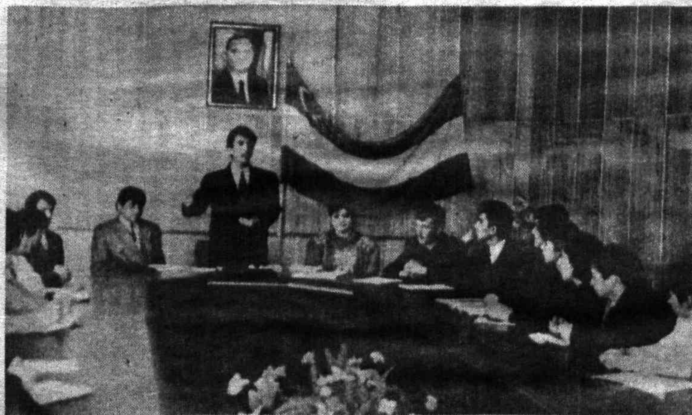
Фото В. ГРАНКИНА.

На снимке: на открытии клуба творческой молодежи области.