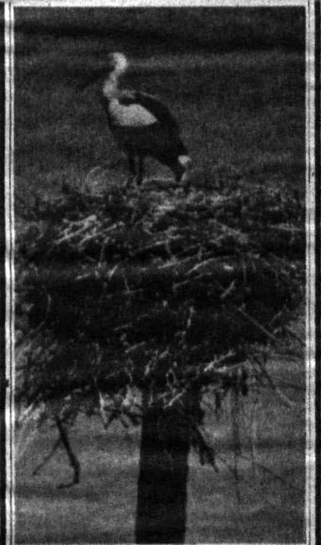
МАТЕРИАЛЫ ПОЛОСЫ «СЕМЬЯ» — стр. 7