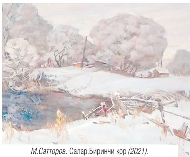
М.Сатторов. Салар.Биринчи қор (2021).

меҳр-муҳаббати яққол намоён бўлиб турибди. В.Енининг "Беш хил рангдаги қўл", Ю.Гребенюкнинг "Тоғлардаги баҳорий тон",