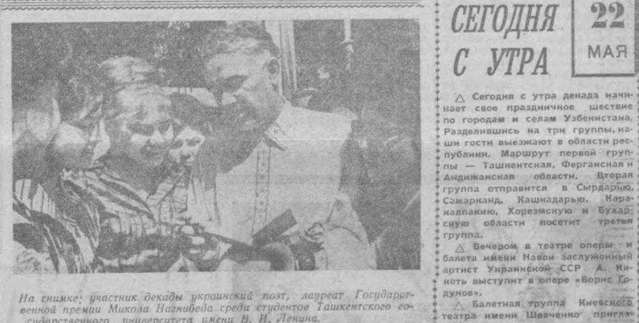
На снимке: участник декады украинский поэт, лауреат Государственной премии Николая Гоголя среди студентов Ташкентского государственного университета имени В. И. Ленина.