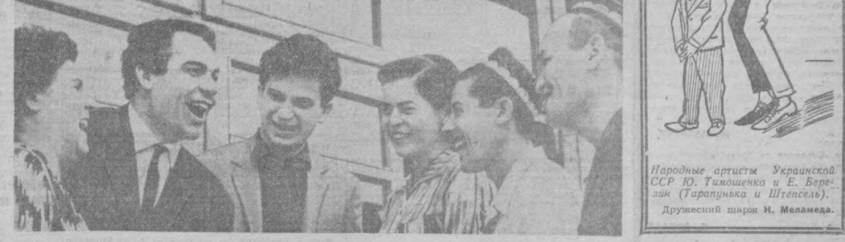
В эти дни на улицах и площадях Ташкента часто можно видеть группы оживленно беседующих людей. Их лица озарены улыбками. Это участники украинской декады литературы и искусства встречаются с жителями столицы республики. На снимке: народный артист СССР Дмитрий Гнатюк и солист Киевского театра оперы и балета имени Т. Г. Шевченко Анатолий Соловьяненко (второй и третий слева) беседуют с ташкентцами.