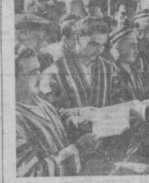
Декада украинской литературы и искусства в Узбекистане. На снимке: на книжном базаре в Ташкенте, сквере возле Театра кукол.