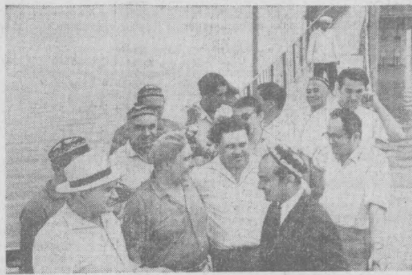
Гости с Украины побывали на Каттакурганской водохранилище. На переднем плане — писатель В. П. Козаченко, народный артист СССР П. П. Кармазюк и композитор П. И. Майборода.