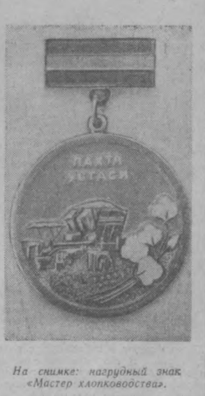
На снимке: нагрудный знак «Мастер хлопководства».

В целях широкого развертывания социалистического соревнования и поощрения сельских труженников на борьбу за дальнейший подъем хлопководства коллегия Министерства сельского хозяйства Узбекской ССР учредила нагрудный знак «Мастер хлопководства». Этим нагрудным знаком будут награждаться колхозники, рабочие совхозов, специалисты, руководители звеньев, бригад, отделений и хозяйств, непосредственно участвующие в хлопководстве, широко внедряющие в производство достижения науки и передового опыта, добивающиеся комплексной механизации процессов возделывания хлопчатника, уборки урожая, снижения себестоимости продукции и систематически в течение 2-3 лет подряд выполняющие планы хлопкозаготовок. Награждение нагрудным знаком «Мастер хлопководства» производится коллегией Министерства сельского хозяйства Узбекской ССР по представлению Министерства сельского хозяйства Каракалпакской АССР и областного управления сельского хозяйства.