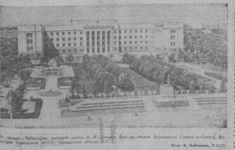
На снимке: Чебоксары, площадь имени В. И. Ленина. Вид на здание Верховного Совета и Совета Министров Чувашской АССР, Чувашского обкома КПСС.

БУХАРА, 23 июня. (По телефону от соб. корр.). Состоялся пленум обкома партии, который обсудил задачи областной партийной организации по дальнейшему увеличению производства сельскохозяйственных продуктов в свете решения мартовского Пленума ЦК КПСС. С докладом выступил первый секретарь обкома К. М. Мурзаев. Пленум рассмотрел перспективный план развития сельского хозяйства области на ближайшие пять лет.