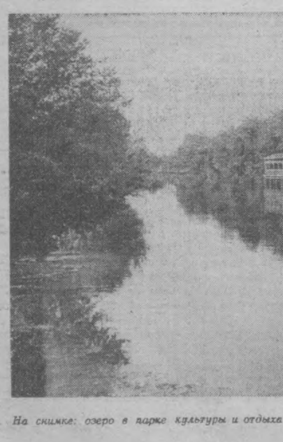
На снимке: озеро в парке культуры и отдыха города Карши.

Свой третий оборонительный матч чемпионата мира футболисты сборной команды СССР выиграли 27 июня у команды Дании — 6:0. Дебют матча завершился на девятой минуте, когда Хусеино, использовав ошибку защитника датчан, открыл счет.