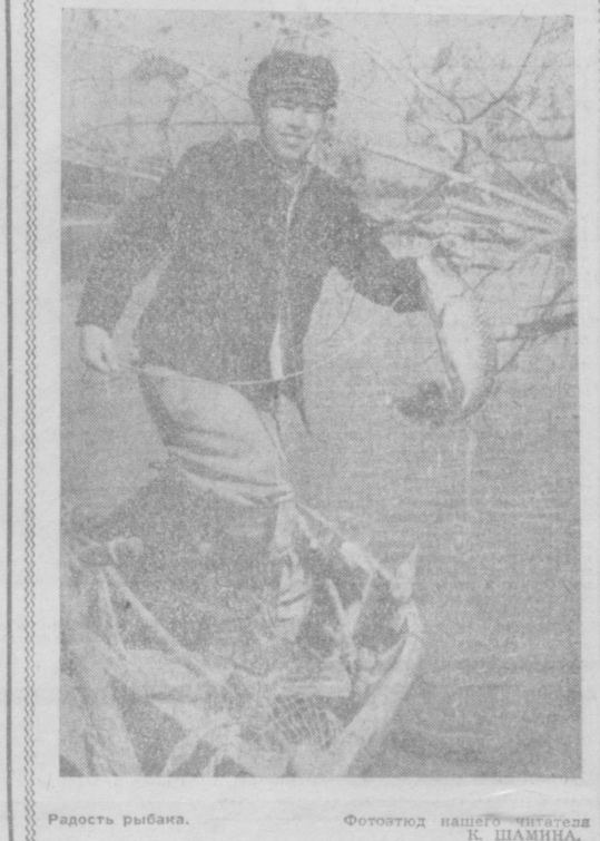
Радость рыбака.

ширеним площадью под этим сортом в зоне производства тонковолокнистого хлопка. Мне, как и другим специалистам области, совершенно непонятно отношение Института селекции и сорту «Т-3», выведенному Сурхандарьинской сельхозинженерной опытной станцией. Заполнения, данные комментными научными учреждениям по этому сорту, свидетельствуют в его пользу. Сорт по качеству волокна относится ко второму типу, разрывная длина, метрический номер, прочность — все соответствует требованиям ГОСТа к волокну второго типа, этот же требованиям отвечает и пряжа, полученная из волокна. Сорт испытывался не только в Сурхандарье, но и в южных районах Туркменистана, Таджикистана, отовсюду поступили самые положительные отзывы. «Т-3» почти совершенно не подвержен заболеваниям фузариозным вилтом, дает крупную корбочку, устойчив и полегающе, прекрасно поддается машинной уборке. Что касается урожайности, то, по данным Термезского госсортуучастка, «Т-3» оказался рекордным среди всех испытывавшихся сортов: он дал 39,2 центнера с гектара. Можно ли сомневаться в ценности, нужности этого широкого рекламировать, настаивать на дальнейшем рас-