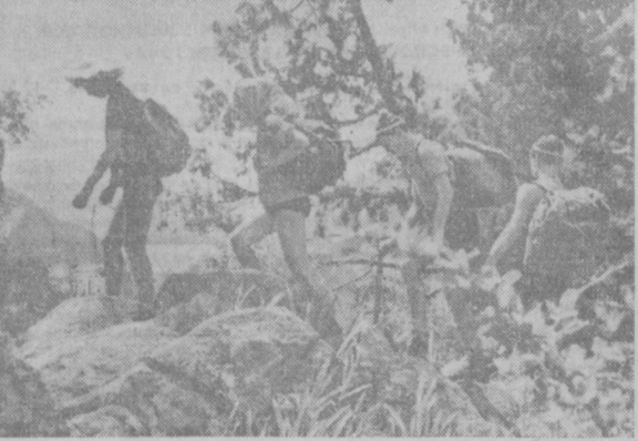
Мягкая, уютная дорога дальше. Спортсмен узбекского добровольного спортивного общества «Динамо» на берегу озера Сары-Челек.