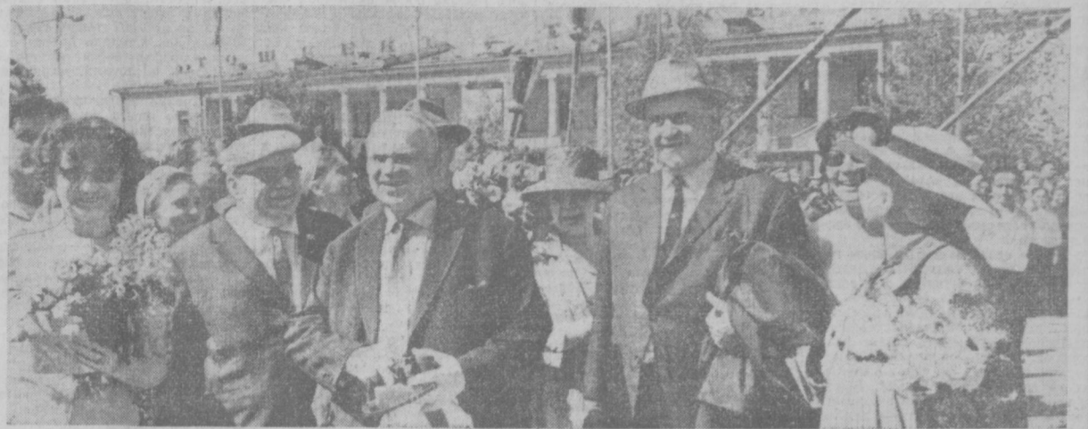
Дорогие гости, приезжайте!