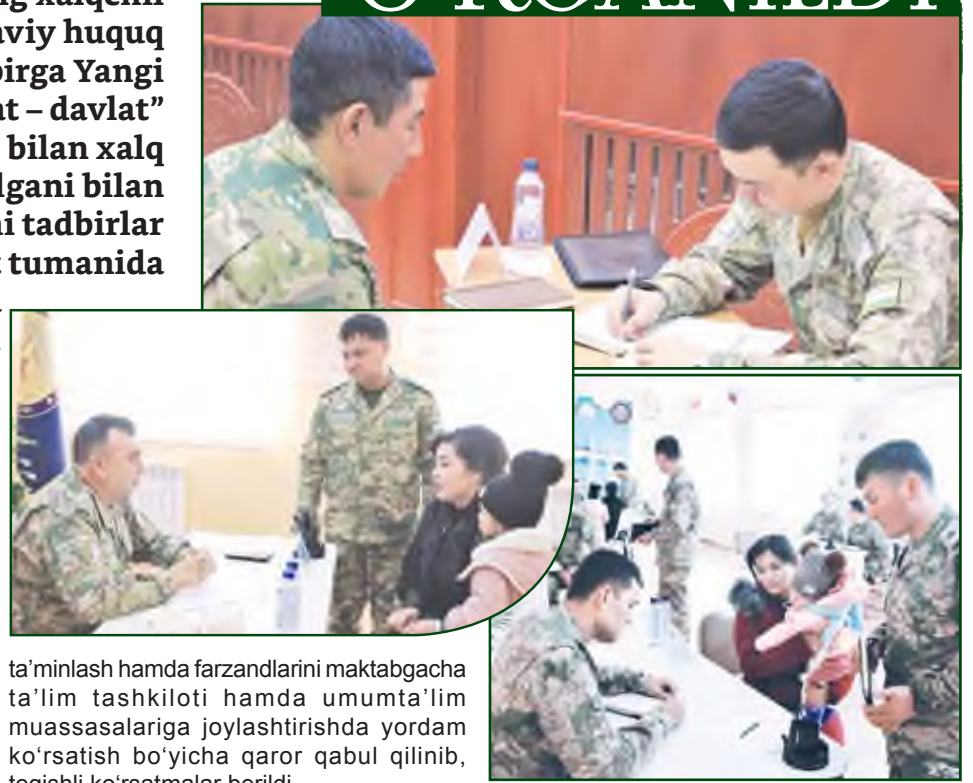
ta'minlash hamda farzandlarini maktabgacha ta'lim tashkiloti hamda umumta'lim muassasalariga joylashtirishda yordam ko'rsatish bo'yicha qaror qabul qilinish, tegishli ko'rsatmalar berildi.

Tadbir davomida ko'pchilikni yillar davomida qiynab kelgan muammoli masalalarga yechim topish, harbiy xizmatchilarning oila a'zolarini ish bilan