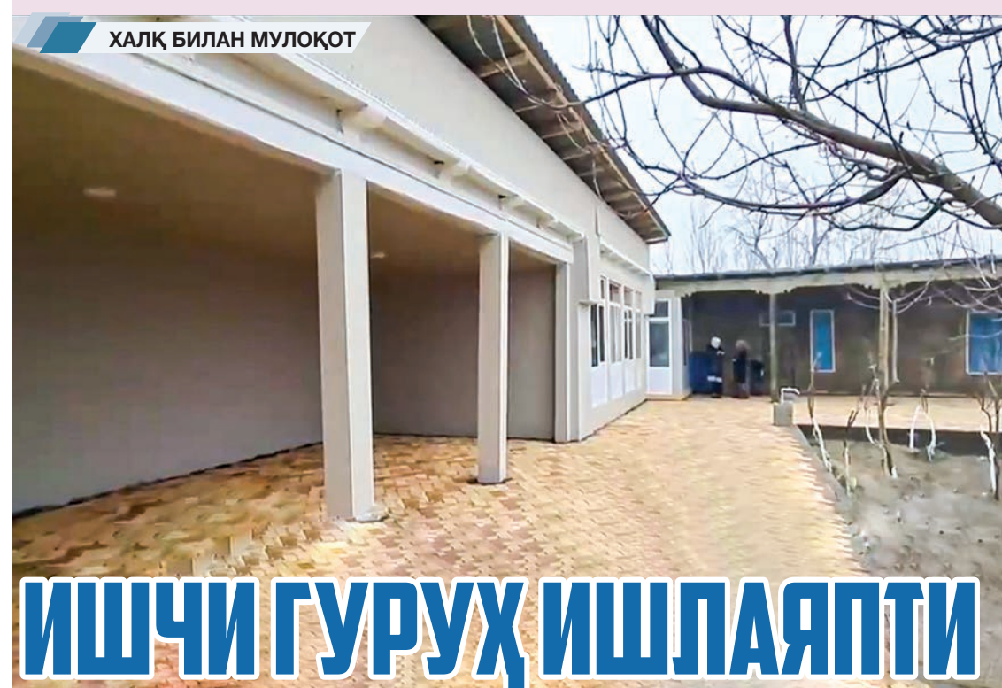
ХАЛҚ БИЛАН МУЛОҚОТ