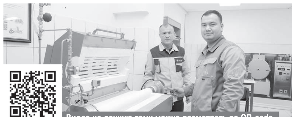
Видео на данную тему можно посмотреть по QR-code.