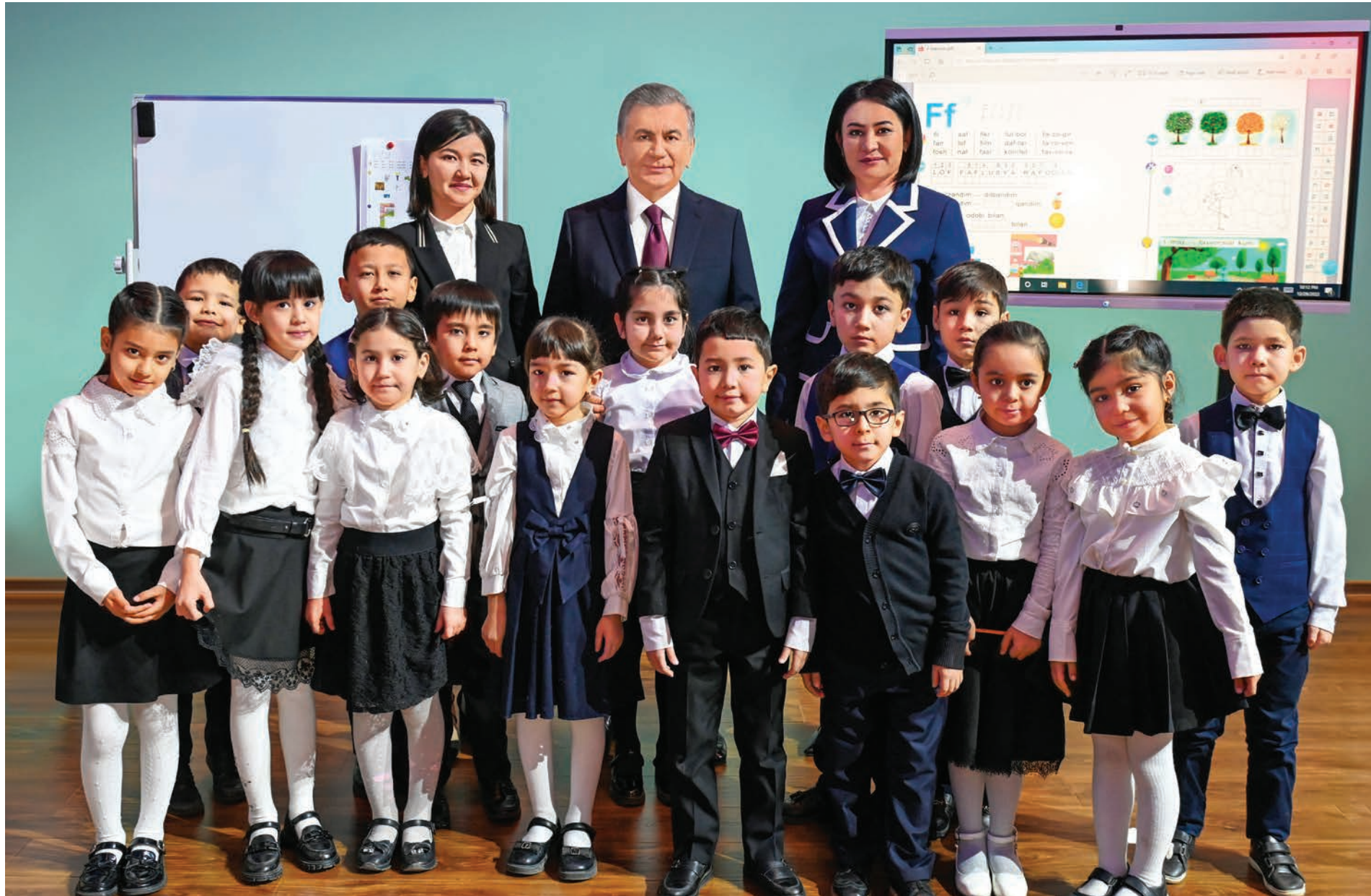
Президент Шавкат Мирзиёев 29 декабря в Международном конгресс-центре ознакомился с выставкой современных учебников «Повышение качества образования - единственно правильный путь развития Нового Узбекистана!»

Наука, образование, воспитание - это краеугольный камень развития, сила, приумножающая мощь страны, отмечал Президент Шавкат Мирзиёев. Поэтому все звенья этой сферы коренным образом реформируются и всесторонне развиваются. Четвертым приоритетом Стратегии развития нашей страны определено развитие сферы образования и человеческого капитала. Логическим продолжением этой работы стало объявление 2023 года в нашей стране Годом заботы о человеке и качественного образования.