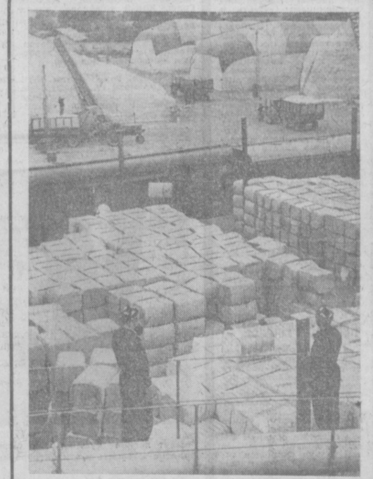
Вот он, хлопковый конвейер в действии! Ленинский хлопководческий завод успешно ведет переработку сырка урожая 1971 года. Кипы с переработанным волоном грузят в товарный состав.

участие был порядок, и на общественные заботы время нашлось. Вместе с другими членами совета урожайности мы регулярно на протяжении всего сезона контролировали ход работ. Сегодня одну бригаду проверим, через две другую. Сравним положение. Что можно, решаем тут же на месте. Крупные вопросы ставим перед административной отделением или совхоза, обсуждаем на заседании партбюро, на партийном собрании. В бригадах Т. Куватли-