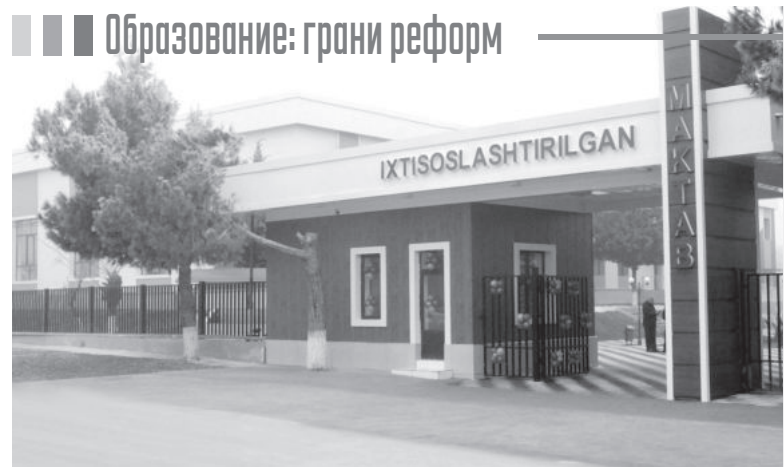
Образование: грани реформ

Мудрая народная поговорка гласит: «Ученые - свет, а неученые - тьма». Образование, воспитание - это путь, который ведет к светлому будущему. Во все времена, во всех странах вопрос образования и воспитания подрастающего поколения был приоритетным, ибо будущее нации, государства находится в руках образованных молодых граждан, интеллигенции.