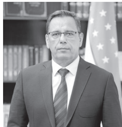
Конратбай Шарипов. Ректор Ташкентского государственного экономического университета.