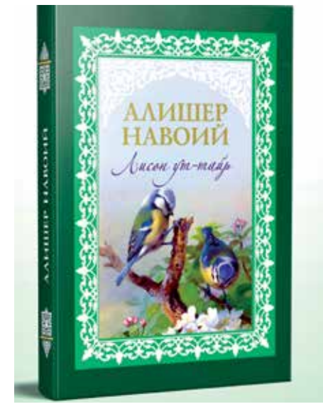
Бойқаро даврига тўғри келади. Шундай эмасми? Сиз бу давр билан боғлиқ қўлёзмаларни ҳам учратган бўлсангиз керак...

— Иброҳим Султон ҳимронлигини давом деган кейинроқ Хиротда адабий муҳит ривожланади ва бу кўпроқ Хусайн