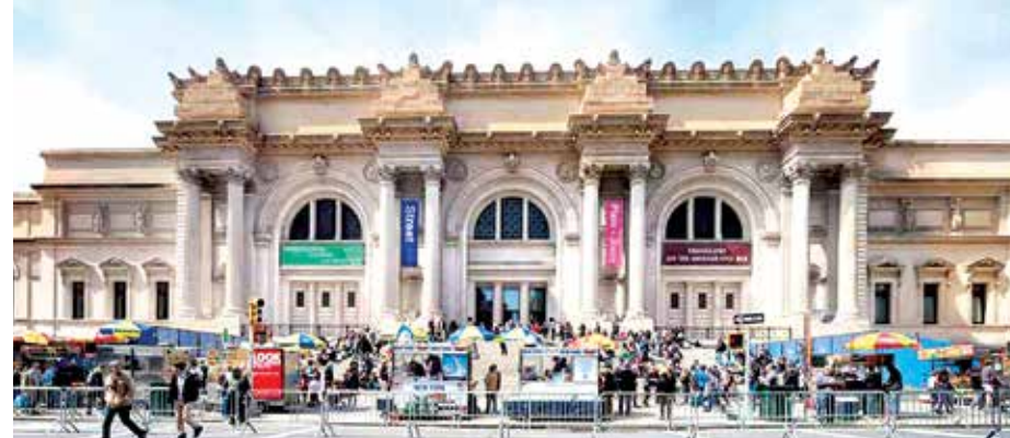
— ҲОЗИРГИ ПАЙТДА АҚШНИНГ НЬУ-ЙОРК ШАҲРИДАГИ МЕТРОПОЛИТЕН САНЪАТ МУЗЕЙИДАМАН. УШБУ МУЗЕЙ ТОМОНИДАН ОЛИМЛАР УЧУН ЭЪЛОН ҚИЛИНГАН БИР ТАНЛОВГА ҚАТНАШИБ, МУЗЕЙ ҚЎЛЁЗМА МАНБАЛАРИ БИЛАН ТАНИШИШ БЎЙИЧА СТИПЕНДИЯНИ ЮТИБ ОЛДИМ. БИР НЕЧА ОЙДАН БЕРИ УШБУ МУЗЕЙДАГИ ҚЎЛЁЗМАЛАР БИЛАН ТАНИШЯМАН.

— Ҳозирги пайтда АҚШнинг Нью-Йорк шаҳридаги Метрополитен санъат музейидаман. Ушбу музей томонидан олимлар учун эълон қилинган бир танловда қатнашиб, муъл қўлёзма манбалари билан танишиб бўйича стипендияни ютиб олдим. Бир неча ойдан бери ушбу музейдаги қўлёзмалар билан танишяман. Теуриийлар даври қўлёзмалари билан боғлиқ мен тақлиф қилган илмий лойиҳа музей раҳбарияти томонидан маъқулланди ва музейнинг ислом санъати бўлимида изланиш олиб боришимга имконият яратиб берди. Лойиҳам мавзуси теуриийлар давридаги қўлёзмалар ва ушбу қўлёзмаларнинг Хирот ҳамда Шерозу Табриз шаҳарларида қўчирилиши билан боғлиқ. Маълумки, ҳозирги Эрон ҳудудида ҳам бир пайтлар теуриийлар ҳимронлик қилган. Теуриийлар набраси, Шоҳруҳнинг ўғли Иброҳим Султон Шерозда ҳимронлик қилган. Уша пайтда Шероз шаҳри форс