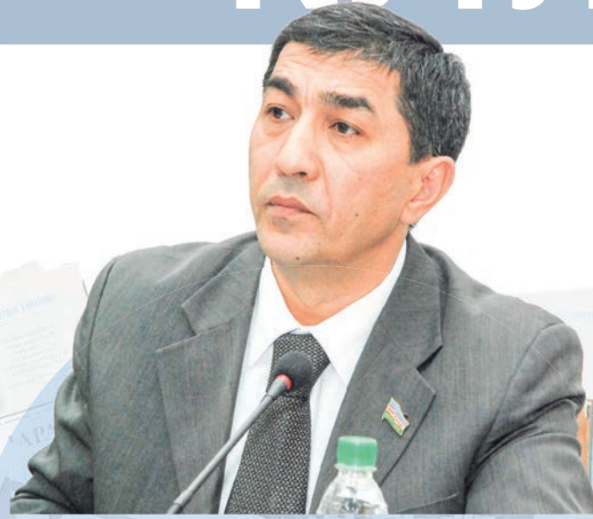
Адҳам ШОДМОНОВ, Олий Мажлис Қонунчилик палатаси депутаты, O'zLiDeP фракцияси аъзоси

“XXI asr” мингга кир... и-я, мингинчи сонини чиқараётми! Демак, муштарийлари билан минг марта узоқлашган. Демак, уларнинг кўнглини қолдирмагандирки, мингинчи бор чоп этилаётми. Офарин! Камина ана шундай “вафодор” муштарийлар сафидан десам лоф бўлади. Аммо “туйбола”миз саҳифаларини безаган энг доврўкли материаллардан доим хабардорлигини айтиб фахрлансам арзийди. Янги аср билан ҳамқадам бораётган, миллий ва жаҳон журналистикасининг шоён илғор анъаналарига содиқ бу нашрнинг серғайрат бош муҳаррир бошлиқ доврўрак, изланувчан жамоасига ҳамиша ҳавас билан қараганман. Бундан бу ёғига ҳам буш келмагайсизлар, ҳамкасб дўстларим! Ҳўқиманган ғўфил ўзидан кўрсин, биз эса ўқийверамиз газетангизни! “XXI asr” номи ўзгаргунча – XXII асрга қадам кўйилгунча бор бўлсин, яшасин, яшасин!