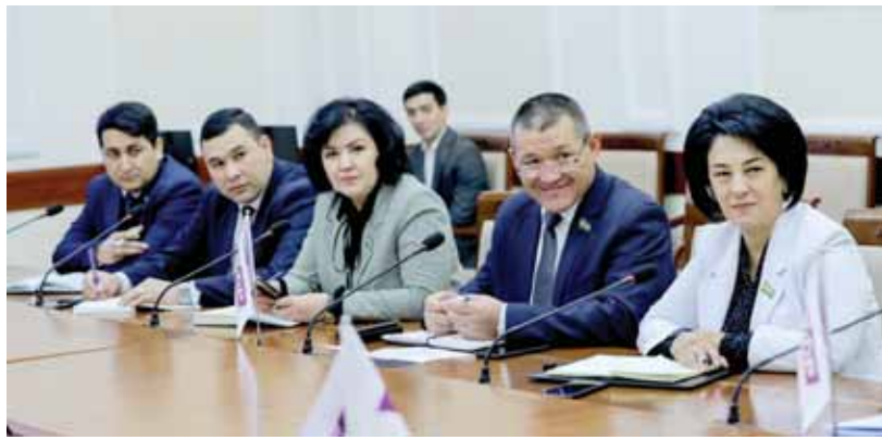
Қонунига банклар устав капиталининг энг кам миқдорини босқичма-босқич оширишга қаратилган ўзгаришлар киритиш ҳақидаги қонун лойиҳаси биринчи ўқишда муҳомада қилинди.

рига бола ҳуқуқлари ҳимоясини янада кучайтиришга қаратилган ўзгариш ва қўшимчалар киритиш тўғрисида"ги қонун лойиҳаси иккинчи