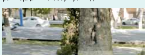
Дарҳақиқат, тозалик бор жойда барак бўлади. Давлатимиз раҳбарининг йиғилишида берган қатъий топшириги асосида вилоятдаги ижтимоий соҳа объектларида, хусусан, 1 204 та мактаб ва болалар богчасида замонавий, махсус чиқинди контейнерлари ўрнатилди.

лигонларида тўлиқ рекултивация ишлари амалга оширилди. Қайта ишлаш ускуналари сони 24 тага қўлайиб, қайта ишлаш даражаси 20 фоиздан 32 фоизга ошди.