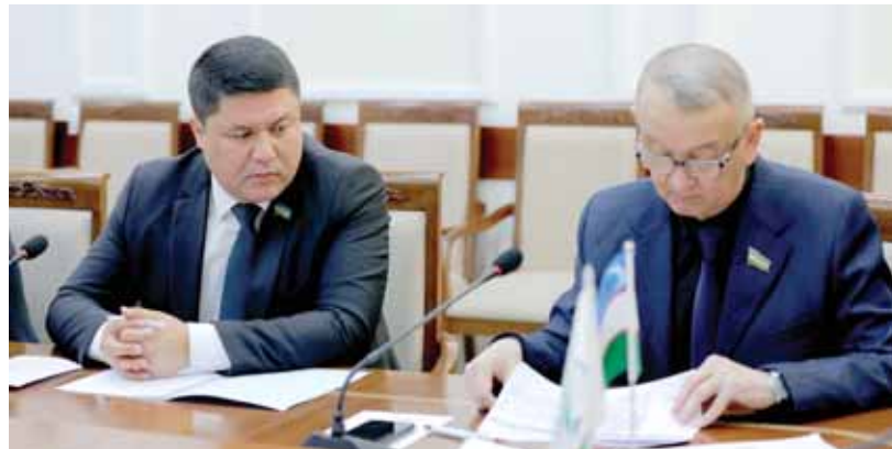
Қонунига банклар устав капиталининг энг кам миқдорини босқичма-босқич оширишга қаратилган ўзгаришлар киритиш ҳақидаги қонун лойиҳасини кiritиш тўғрисида"ги қўшимча қилинмоқда.

Шунингдек, "Молиявий истеъмол кредити бериш тизими такомиллаштириши муносабати билан "Истеъмол кредити тўғрисида"ги Ўзбекистон Республикаси Қонунининг 15-моддасига ўзгартириш киритиш ҳақида"ги қўшимча қилинмоқда.