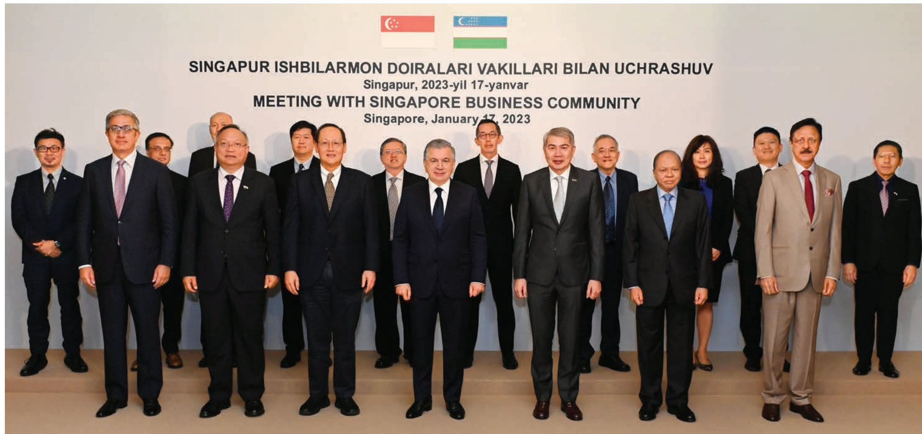
SINGAPUR ISHBILARMON DOIRALARI VAKILLARI BILAN UCHRASHUV