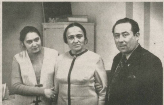
Суратда: Зулфия шоирлар Гулчехра Жўраева ва Сайёр билан.

Зулфия опа вақт, яъни умр олдидаги масъулиятни ҳамиша улғайган қалб билан ҳис этганини кўзатамиз. У "Ҳаёт китобини бехос варақлаб..." деб бошланувчи машҳур шеърини олтимиш ёшлар остонасида ёзганди. Ундан кейин кечган қарийб чорак асрлик умри ҳам шу сатрлар мағзидаги эътирофга ҳамоҳанг.