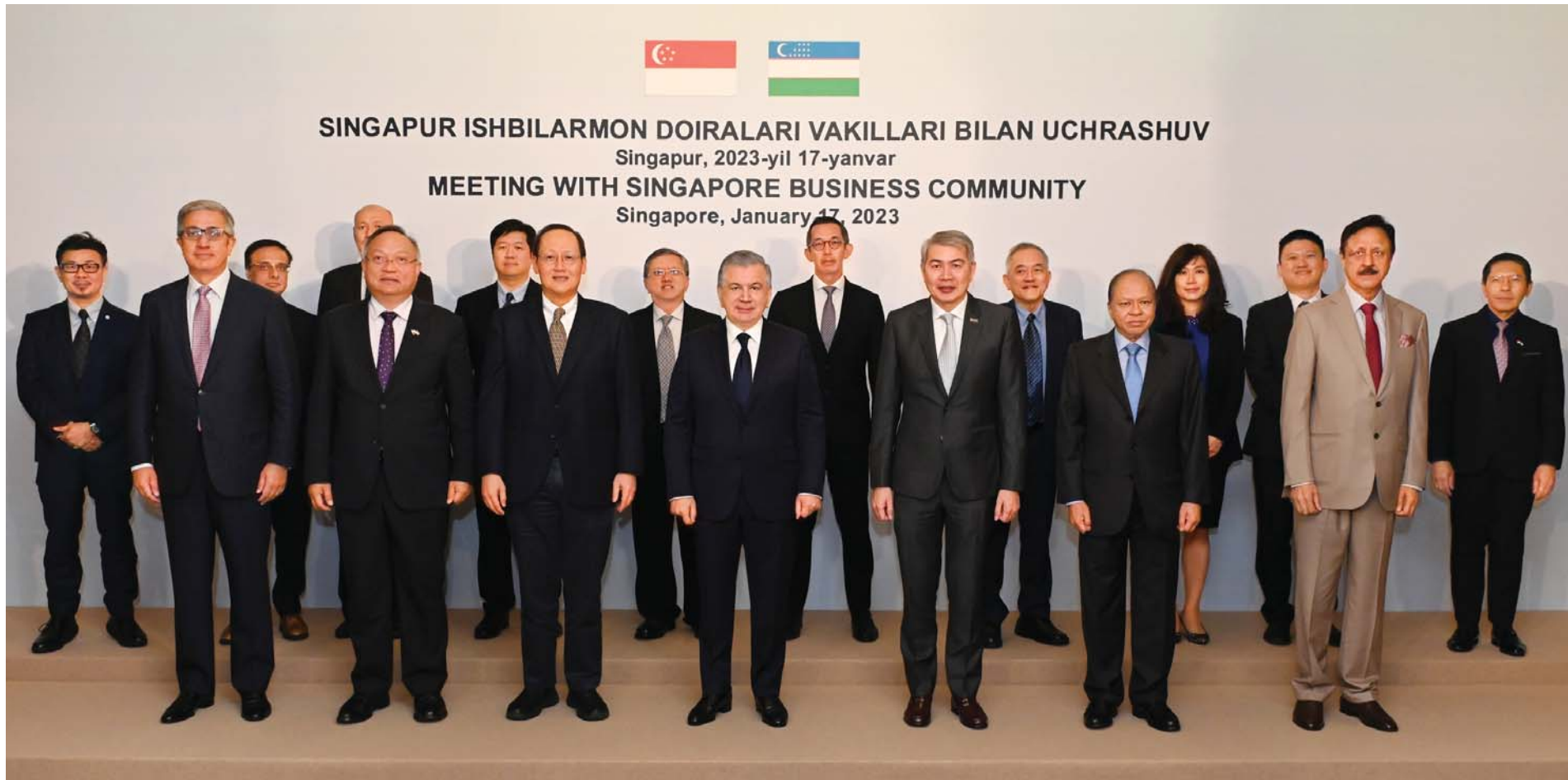
SINGAPUR ISHBILARMON DOIRALARI VAKILLARI BILAN UCHRASHUV Singapore, 2023-yil 17-yanvar MEETING WITH SINGAPORE BUSINESS COMMUNITY Singapore, January 17, 2023