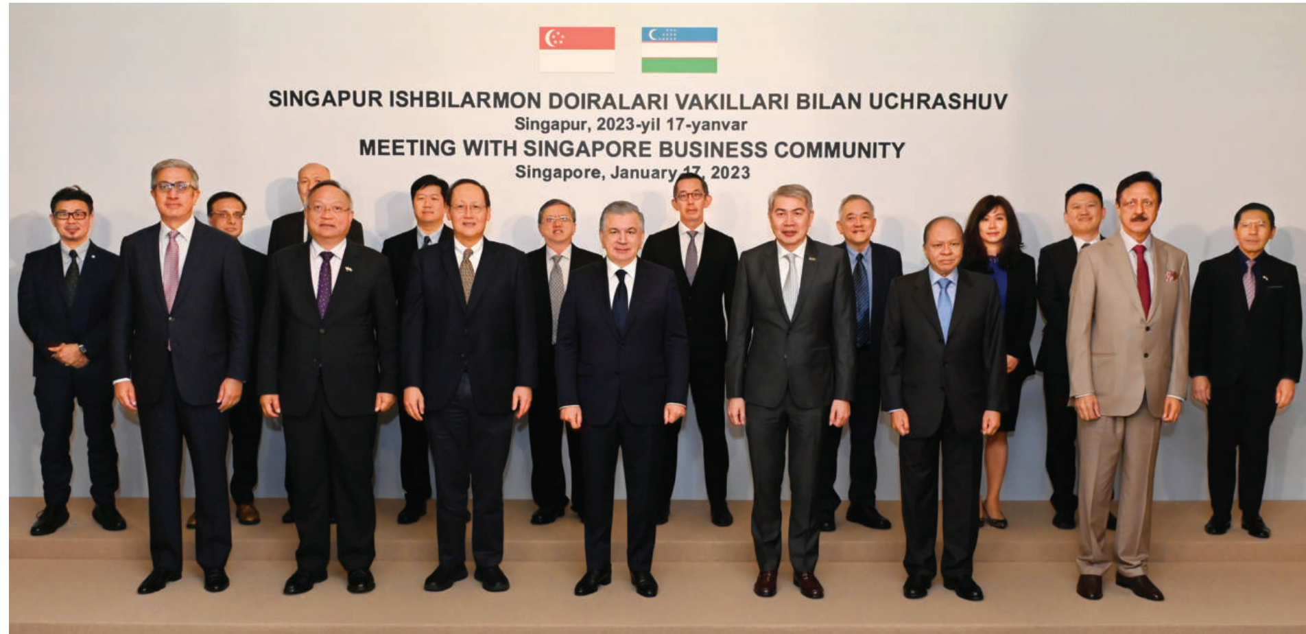
SINGAPUR ISHBILARMON DOIRALARI VAKILLARI BILAN UCHRASHUV Singapore, 2023-yil 17-yanvar MEETING WITH SINGAPORE BUSINESS COMMUNITY Singapore, January 17, 2023

Шуларни ҳисобга олиб, давлатимиз раҳбари Сингапур билан яқин истиқболдаги ҳамкорликнинг олти тарафли асосий йўналишини кўрсатиб ўтди.