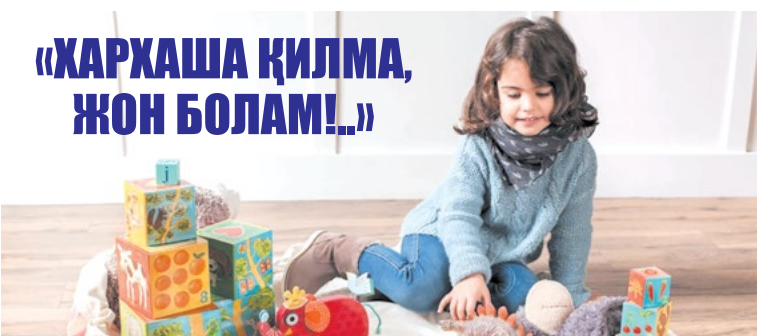
«ХАРҚАША ҚИЛМА, ЖОН БОЛАМ!»