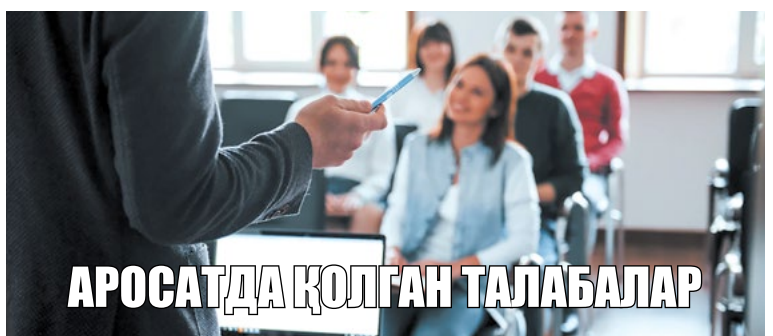
АРОСАТДА ҚОЛГАН ТАЛАБАЛАР