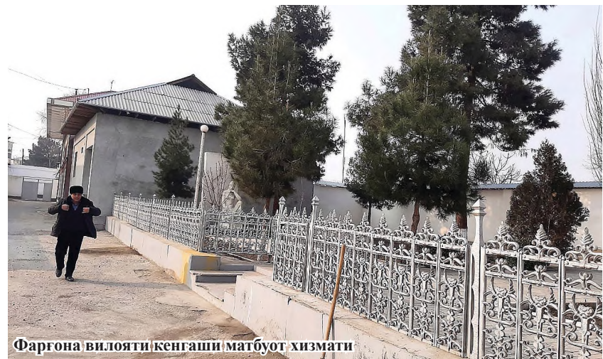
Фарғона вилоятни кенгаши матбуот хизмати