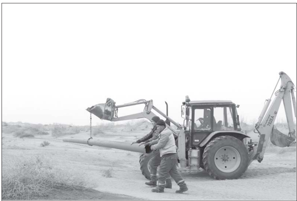
Омодаги ба ҳар гуна инчиқои табиат, ба ноқулаи обу ҳаво нигоҳ накарда, дастрас гардондани «оташи сабз» вази фаи асоси вакилони соҳаи таъминоти газ мебошад. Барои ба газ таъмин кардани истеъмолгарони минтақа озоди иқтисоди «Тирмиз» ва шаҳри Тирмиз корҳои сохтмони нуктаи гази фишораш баланд, ки 38,9 километр тӯл қашади, диаметраш 219 мм мебошад, бо суръат идора дорад. Он ба АГРС-и «Қароқир», ки дар ҳудуди маҳаллаи Баҳори ноҳияи Ангор ҷойгир аст, пайваст мегардад. Ба лоиҳа техника махсус ҷалб гардидааст. Аз ҷониби филиали таъминоти гази «Худудгаз Сурхондарё» ва ходимони идораи сохтмону монтажи устуворсозии кубурҳо дар масоҳати бештар аз 30 километр ба амал барварда шудааст. Дар сурат: лавҳа аз корҳои сохтмони нуктаи газ.