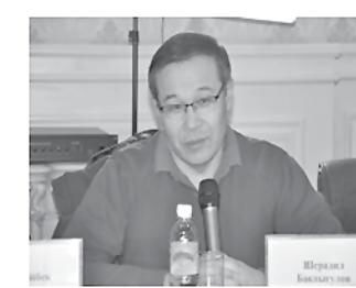
— Пеш аз ҷама мехостам зикр намоям, ки аз замони Президентии Ўзбекистон интиҳо шудани Шавкат Мирзиёев ин аллакай сафари дуҷуми давлатии ӯ ба Қирғизистон аст. Соли гузашта роҳбари давлати мо

Садир Чапаров ба Тошканд ташриф фармуда буд. Солҳои дароз ин иқдом мушоҳида кард, он дараҷа ва мустақимии қарордодҳоеро нишон медиҳад, ки соҳаи охири ба миён омадаанд.