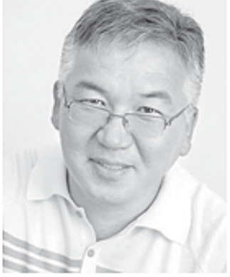
— Сафари давлатии Президент Шавкат Мирзиёев ба Қирғизистон, бидуни

муволиға, воқеаи муҳимтарин гардид. Осиёи Марказӣ бар хилофи таъкиду қўиши баъзе қувваҳои берунӣ, ки мехостанд кишварҳоро аз ҳам ҷудо кунанд, ба минтақаи ягона табдил меёбад. Сарони Қирғизистон ва Ўзбекистон дар алоқаи қомил бо ҳамкори қазоқистонии худ соҳати умумиро, ки он барои халқҳои мо хубу бехатар хоҳад буд, таъкид менамоянд. Ин кор идора дорад ва пешравияш назаррас аст.