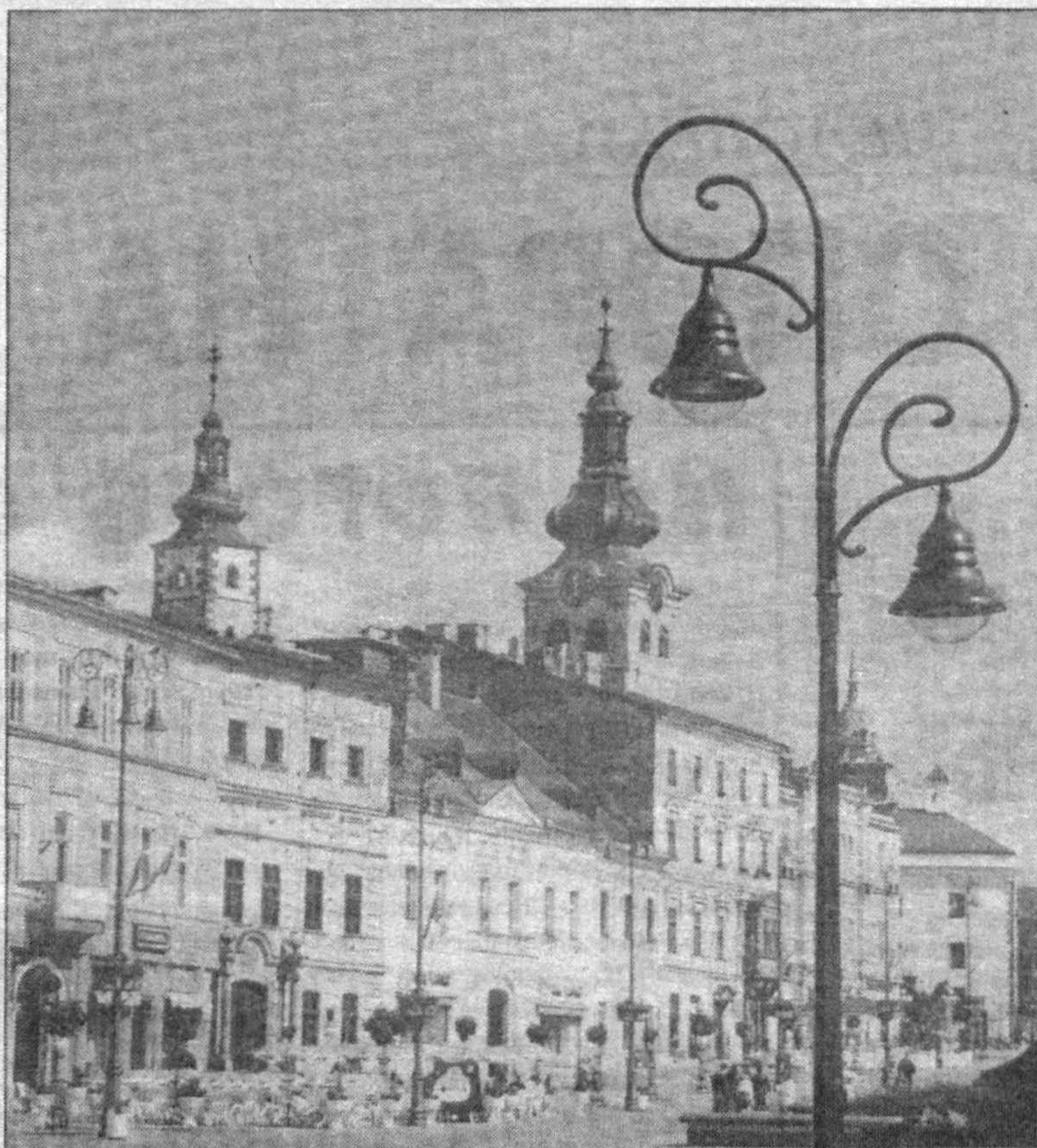
ПО СТРАНАМ МИРА. Словакия. Город Банска Быстрица.

— От имени вьетнамского народа и его правительства поздравляю узбекский народ с 6-й годовщиной независимости страны и желаю Президенту Исламу Каримову и узбекскому народу благополучия и процветания.