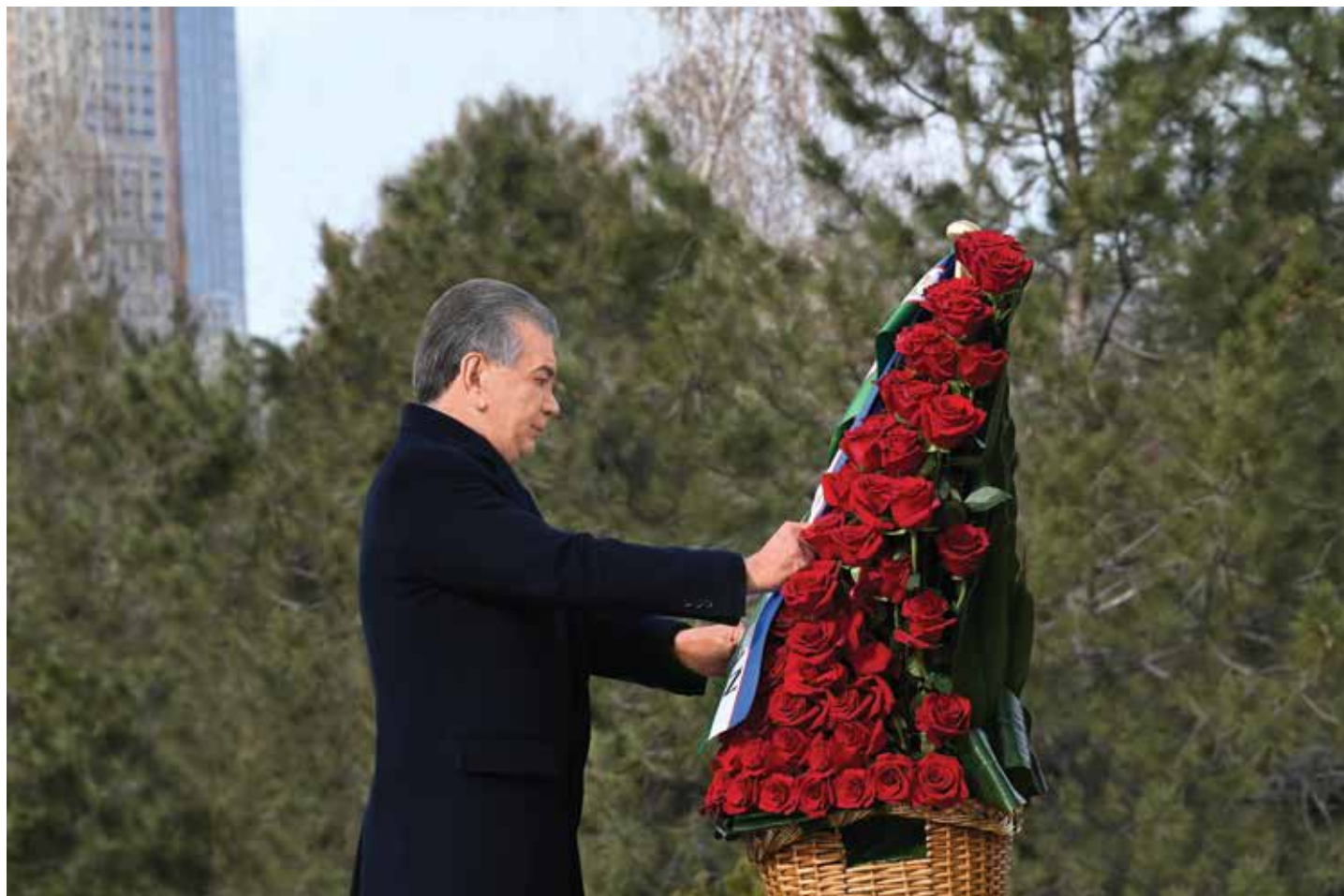
Олий Мажлис палаталари, Президент Администрацияси ва ҳукумат вакиллари, илм-фан ва маданият намояндалари, зиёлилар ҳам Биринчи Президентимиз хотирасига ҳурмат кўрсатди.

30 январь, Тошкент шаҳри. Анъанадагидек, Ислом Каримов номидаги илмий-маърифий ёдгорлик мажмуасига кенг жамоатчилик йиғилди. Президент Шавкат Мирзиёев бу ерга ташриф буюриб, Ислом Каримов ҳайкали пойига гулчамбар қўйди.