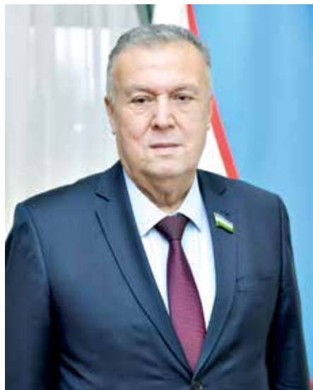
Бахтиёр САЙФУЛЛАЕВ, Олий Мажлис Сенатининг Ёшлар, маданият ва спорт масалалари қўмитаси раиси