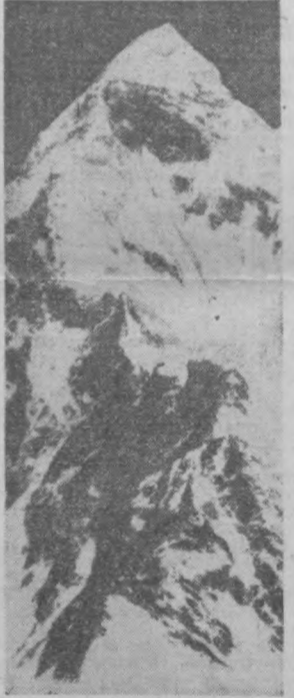
Пик Коммунистической академии.