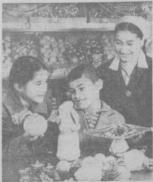
Скоро — Новый год. Анджанцы в эти дни получили хороший подарок — в городе открылся магазин «Детский мир». На снимке: в отделе ёлочных украшений нового магазина.