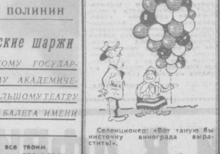
Селекционер: «Вот таную бы нисточку винограда выростить!»