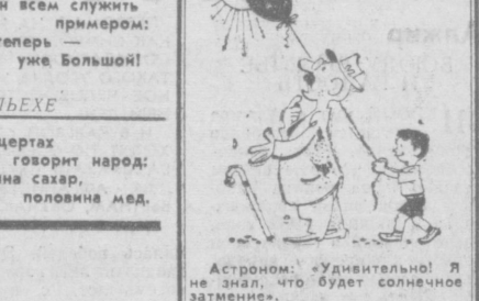
Астроном: «Удивительно! Я не знал, что будет солнечное затмение.»