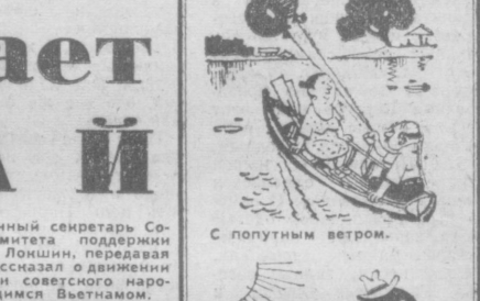
С попутным ветром.