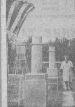
Исполнилось сто лет метеорологической станции «Ташкент». На снимке: площадь метеостанции.