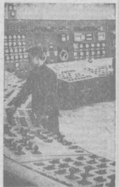
Навийская ГРЭС дает ток Бухарской, Самаркандской, Кашкарской областям и некоторым областям Туркменской ССР. На снимке: пульт управления четвертого блока.