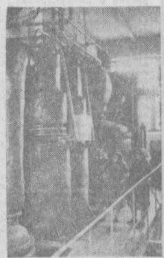
На Андрианском маслозиркомбинате начал работать новый цех по производству жирных кислот — высококачественного сырья для мыловаренной промышленности. Новый вид продукции, получаемой из отходов рафинации черного масла, ранее не использовавшегося, отправляется потребителям нашей республики и Российской Федерации. На снимке: цех жирных кислот.