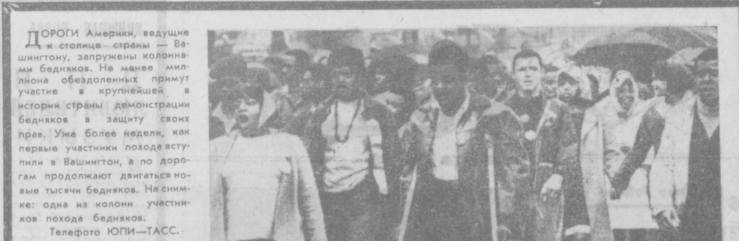
ДОРОГИ Америки, ведущие к столице страны — Вашингтону, запружены колоннами бедняков. Не менее миллиона обездоленных принимают участие в крупнейших в истории страны демонстрациях бедняков в защиту своих прав. Уже более недели, как первые участники похода выступили в Вашингтоне, а по дороге продолжают двигаться новые тысячи бедняков. На снимке: одна из колонн участников похода бедняков.