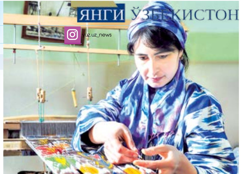
Ҳеч ким муаммолари билан ёлғиз қолмайди